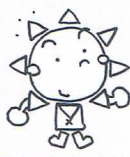
福祉まつりキャラクター「サニーくん」