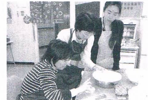
みんなで手分けして調理します。なにができるかな？(キラ星☆)

若年の高次脳機能障がい者の余暇活動の場「キラ星☆」、作業体験の場「若草」、デイサービス「クローバー」などの活動をしています。